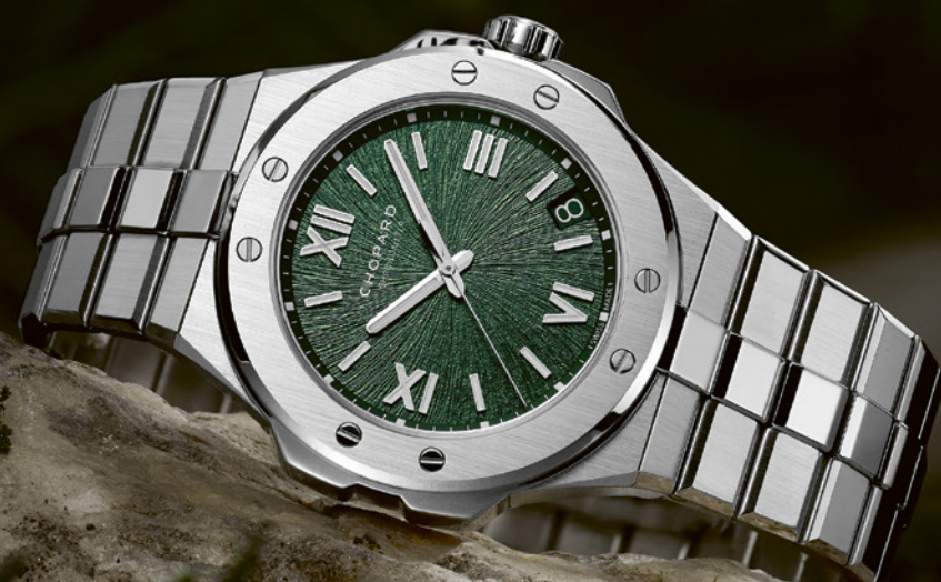
Chopard Alpine Eagle 41

Ce que l'on aime, déjà, dans ce cadran aux motifs inspirés de l'iris de l'aigle, c'est cette magnifique couleur vert pin, obtenue par traitement galvanique, qui fait ressortir les chiffres romains et index rhodiés luminescents. Aussi positivement minimaliste qu'exceptionnel, ce garde-temps, logé dans un boîtier en acier inoxydable de 41 mm, bat au rythme d'un calibre maison certifié COSC, bénéficiant de 60 h de réserve de marche.