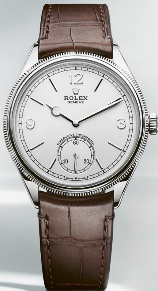
Rolex Perpetual 1908

1908 : année de création de la marque par Hans Wilsdorf. Cent-dix-sept ans plus tard, ce nouveau garde-temps perpétue l'identité esthétique des origines, avec un boîtier façonné en or gris 18K – ou en platine 950 – de 39 mm, à la finition polie. Alliant délicatesse et performances, le mouvement à remontage automatique intègre petite seconde à 6 h, fonction stop seconde et certification Chronomètre Superlatif. Le bracelet ? En cuir d'alligator.