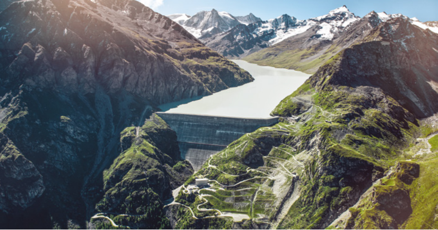
La Grande-Dixence, le barrage-poids le plus haut du monde avec ses 285 m, permet d'alimenter plus d'un demi-million de ménages en électricité.

Conception, ingénierie, exploitation, maintenance, la Suisse maîtrise toute la chaîne d'expertise dans ce domaine. Ses innovations techniques s'exportent de la Chine à l'Amérique du Sud, en passant par la Norvège.