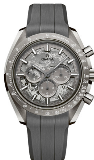
Omega Speedmaster Grey Side of the Moon

Cette pépite astrale rend hommage à l'exploration spatiale avec son boîtier de 44,25 mm en céramique grise polie et satinée révélant une représentation de la surface de la Lune, gravée au laser sur les ponts et la platine. L'ensemble, harmonieux, intègre trois compteurs, 30 min, 12h et petite seconde, et une échelle tachymétrique. En clin d'œil, cette citation gravée sur le fond du boîtier, attribuée à l'astronaute Jim Lovell : « The Moon is Essentially Grey ».