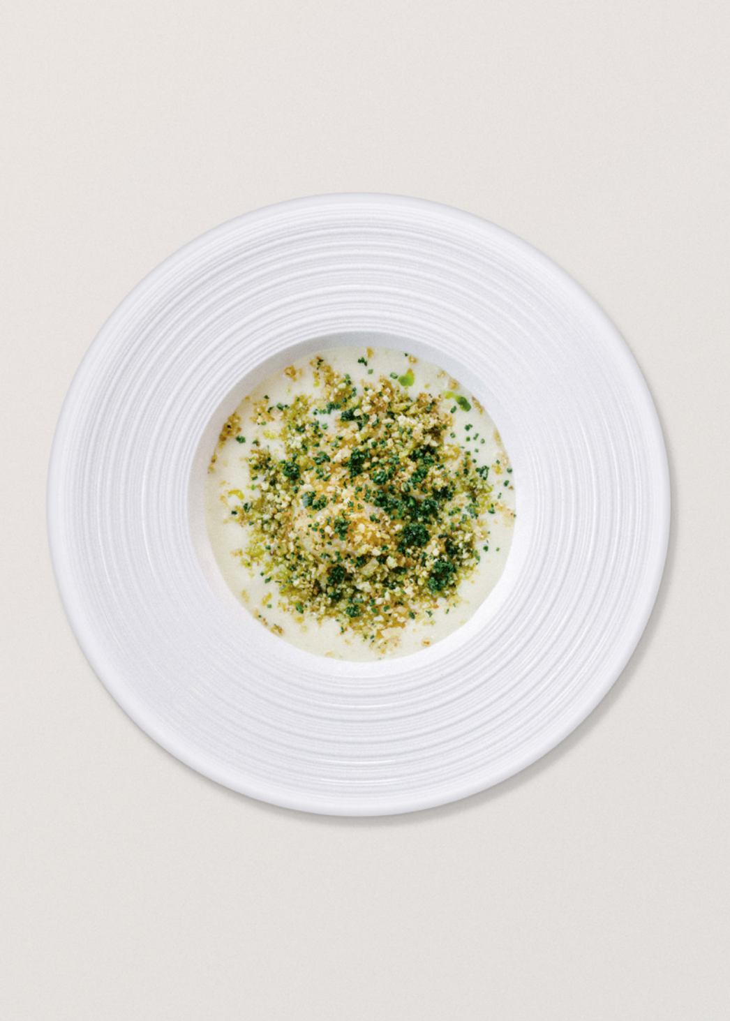
Au Marmo, œuf bio poché à 64°C, mousse légère de pommes de terre aux cèpes du Piémont et crumble d'herbes et de levure. Étonnant!

Côté papilles, aucune station du pays ne lui arrive à la cheville. Avec sa pléthore de bonnes tables éparpillées entre cœur de village et alpages, Zermatt mange (très) bien. Classiques stuben aux bonnes odeurs de fromage fondu, chalets faussement rustiques, gastronomie inventive de haut vol, tables exotiques, options végétariennes (même en menus)... On est vraiment là dans l'embarras du choix, sur fond, souvent, de produits locaux de saison. Petit palmarès.