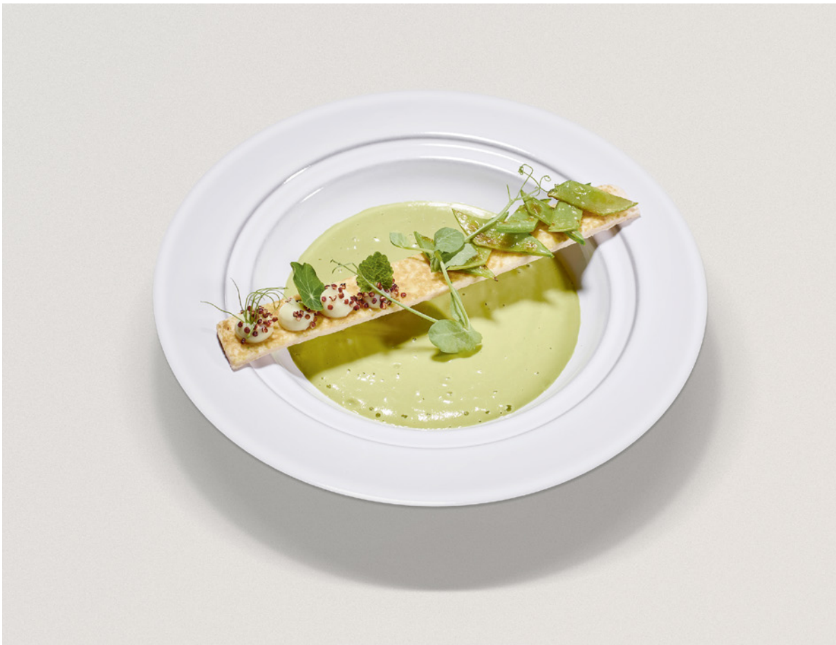
À l'After Seven du Backstage Hotel, la soupe de petits bois épouse le wasabi, sous un pont de pâte feuilletée, crème chiboust aux petits pois et menthe.