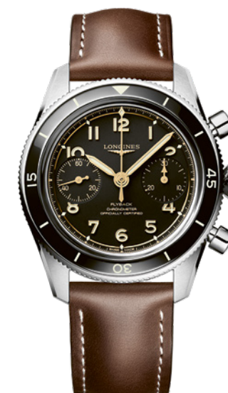
Longines Spirit Flyback

Forte de près d'un siècle d'héritage aéronautique, Longines dévoile une nouveauté séduisante pour 2025, la Spirit Flyback. Revisité – et pourtant fidèle à l'esthétique de la collection – ce chronographe avec retour en vol adopte un boîtier en acier inoxydable de 39,5 mm avec lunette tournante bidirectionnelle et, pour la première fois, un minuteur offrant un compte à rebours clair et précis. Réserve de marche de 68 h et certification COSC.