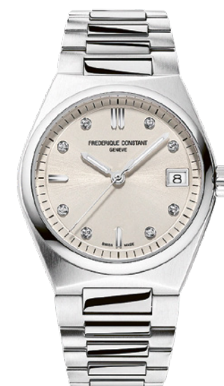
Frédérique Constant Highlife Ladies Quartz

Boîtier de 31 mm pour 7,29 mm d'épaisseur, cette montre aux proportions toutes féminines allie élégance contemporaine et finition raffinée. Étanche à 50 m, elle embarque le calibre quartz FC 240, promettant 60 mois d'autonomie. Le cadran, avec guichet de date à 3 h, propose des index doublés à 12 h et simples à 6 h et 9 h, 8 diamants marquant les index restant. Le bracelet intégré en acier est interchangeable avec un modèle en caoutchouc.