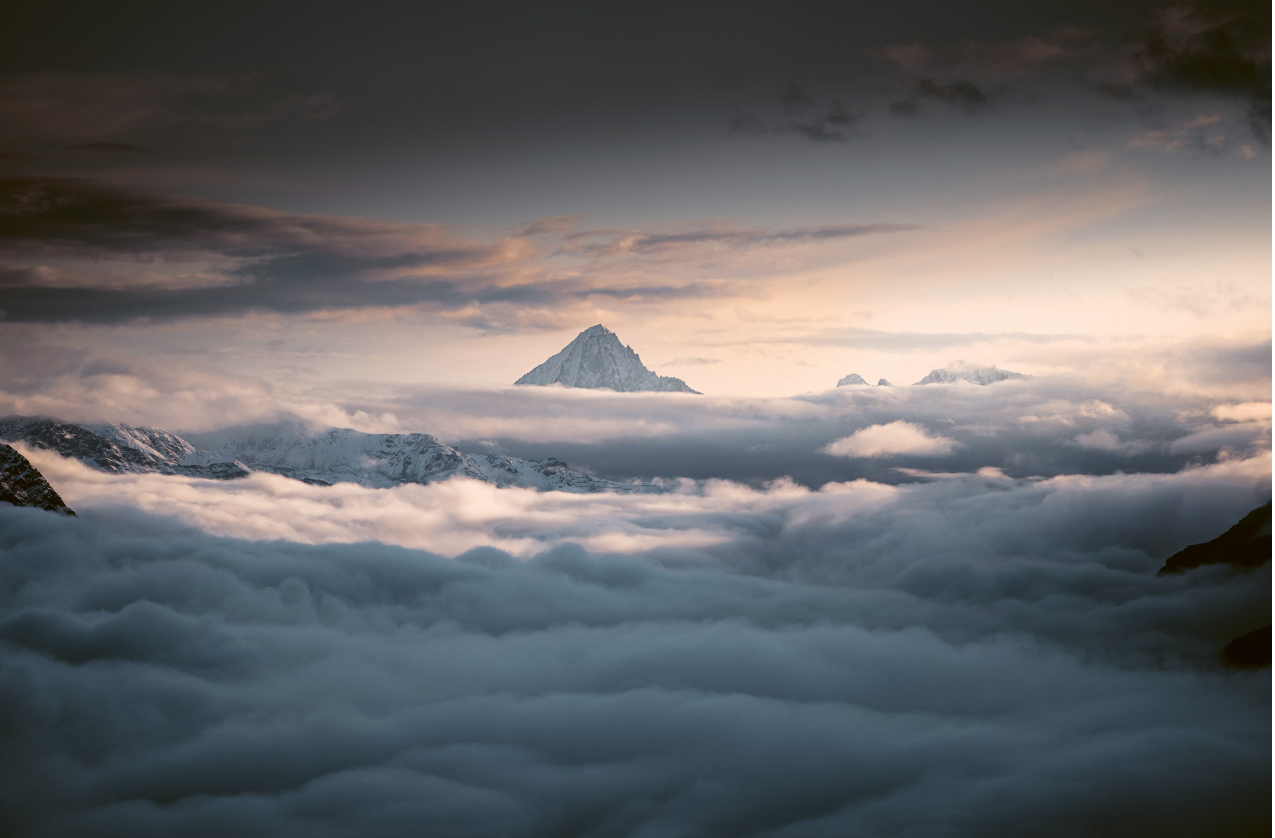
Vu de Zermatt, le Bietschhorn émerge, solitaire, au-delà de la vallée du Rhône, nimbé des lueurs rosées du couchant. Sous les nuages, la Mattertal s'endort.