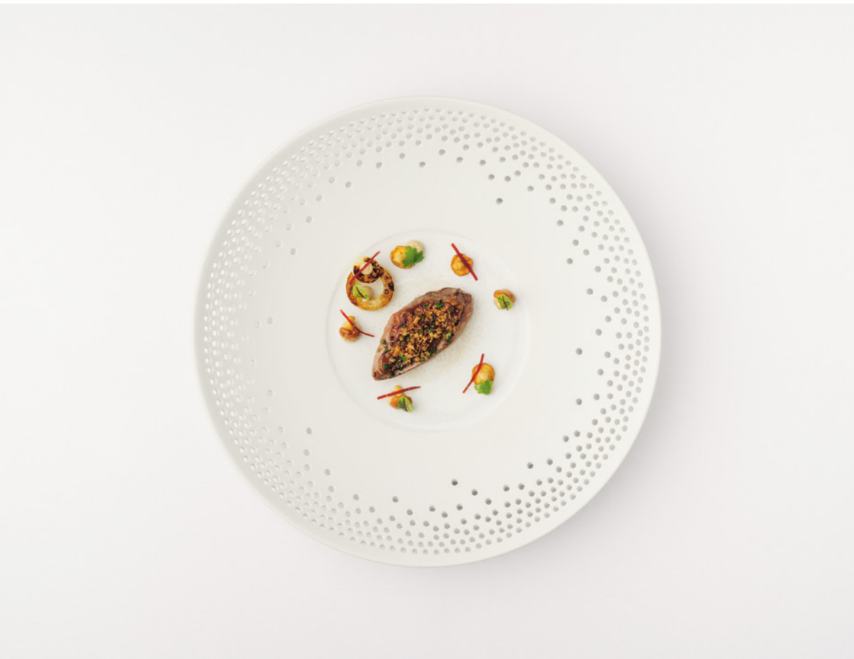
Pigeon, viande séchée locale, céleri et chanterelles : une autre impression d'automne à l'Alpine Gourmet Prato Borni.