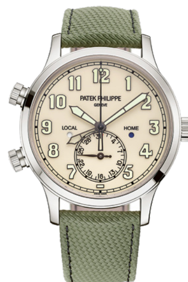
Patek Philippe Calatrava Pilot Travel Time 5524G-010

Les montres de pilote ont vu leur popularité rebondir depuis quelques années – les vintage plus encore. Cette pièce signée Patek Philippe en est le meilleur exemple de 2025. Une séductrice assurément, habillée d'un boîtier en or gris enlaçant un cadran laqué ivoire et accompagnée d'un bracelet en matière composite vert kaki au motif tissu. Parmi ses précieuses complications : double fuseau horaire et indication jour/nuit locale.