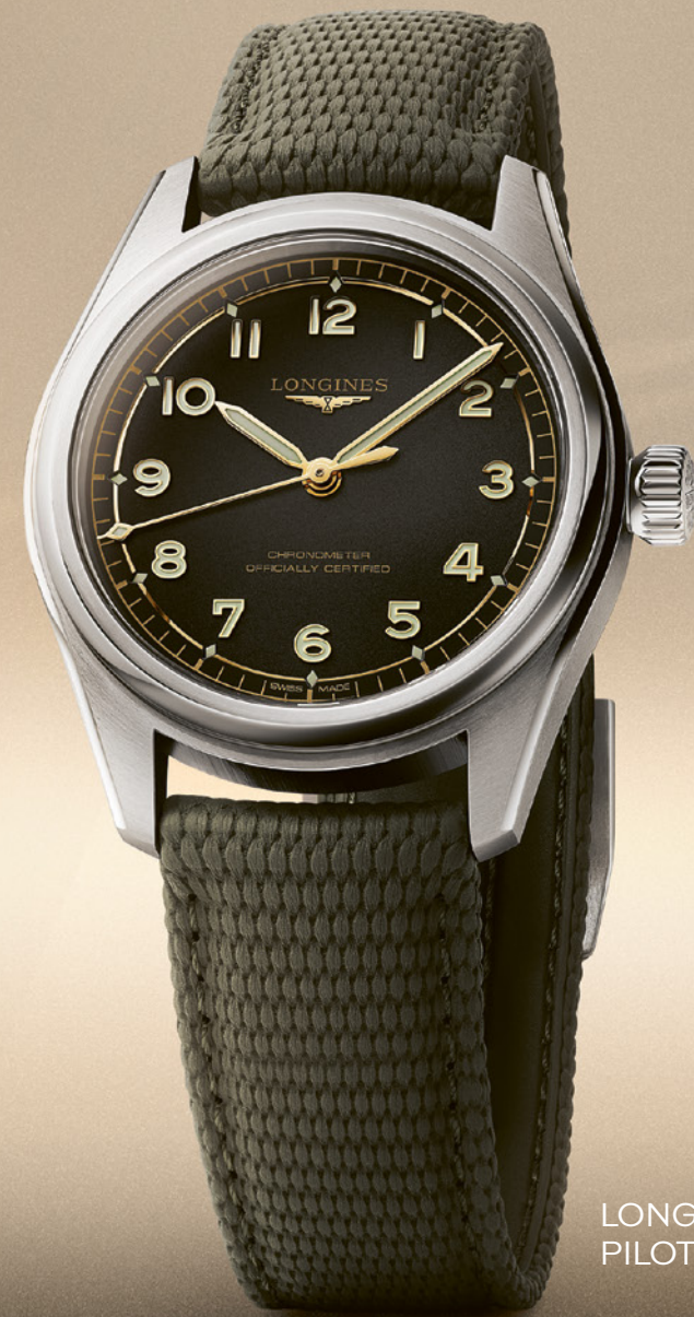
LONGINES SPIRIT PILOT