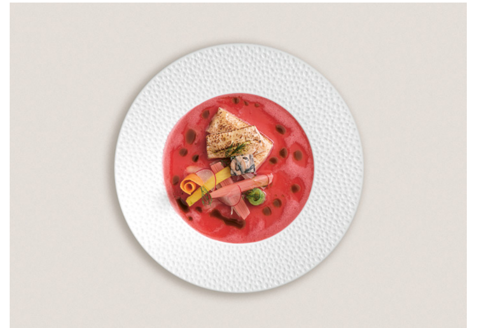
Au restaurant Saveurs de l'Hôtel Schönegg, la truite saumonée, flambée, nage dans un superbe ceviche de rhubarbe au bouillon rosé.