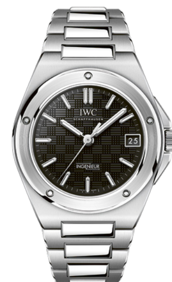
IWC Ingenieur Automatic 35

Ce garde-temps incarne l'ADN sportif raffiné d'IWC Schaffhausen dans un format plus compact de 35,1 mm, pour 9,4 mm d'épaisseur seulement. Ses caractéristiques principales ? Un cadran en acier fin au motif « grid » aussi élégant que discret, avec guichet de date à 3h, ainsi qu'une lunette à cinq vis, le tout porté par un bracelet intégré du même matériau. Le calibre automatique maison offre une réserve de marche de 42h.