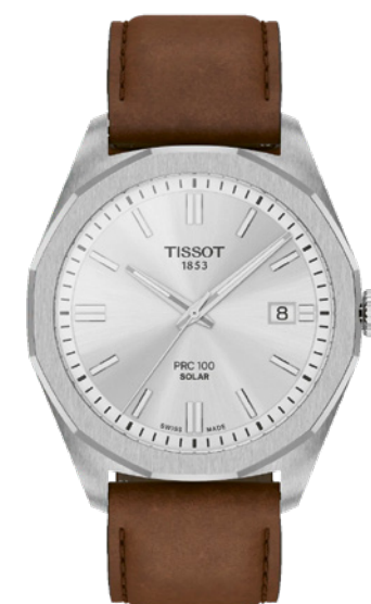
Tissot PRC 100 Solar 39 mm

Précision et énergie solaire se donnent rendez-vous dans ce garde-temps au design unique de la collection PRC 100. Grâce au mouvement à quartz pionnier Lightmaster Solar, qui exploite l'énergie photovoltaïque, la montre offre jusqu'à 14 mois d'autonomie après une charge complète. Lunette dodécagonale, cadran épuré de 39 mm, aiguilles luminescentes et bracelet interchangeable pour un style à la fois sportif et élégant.