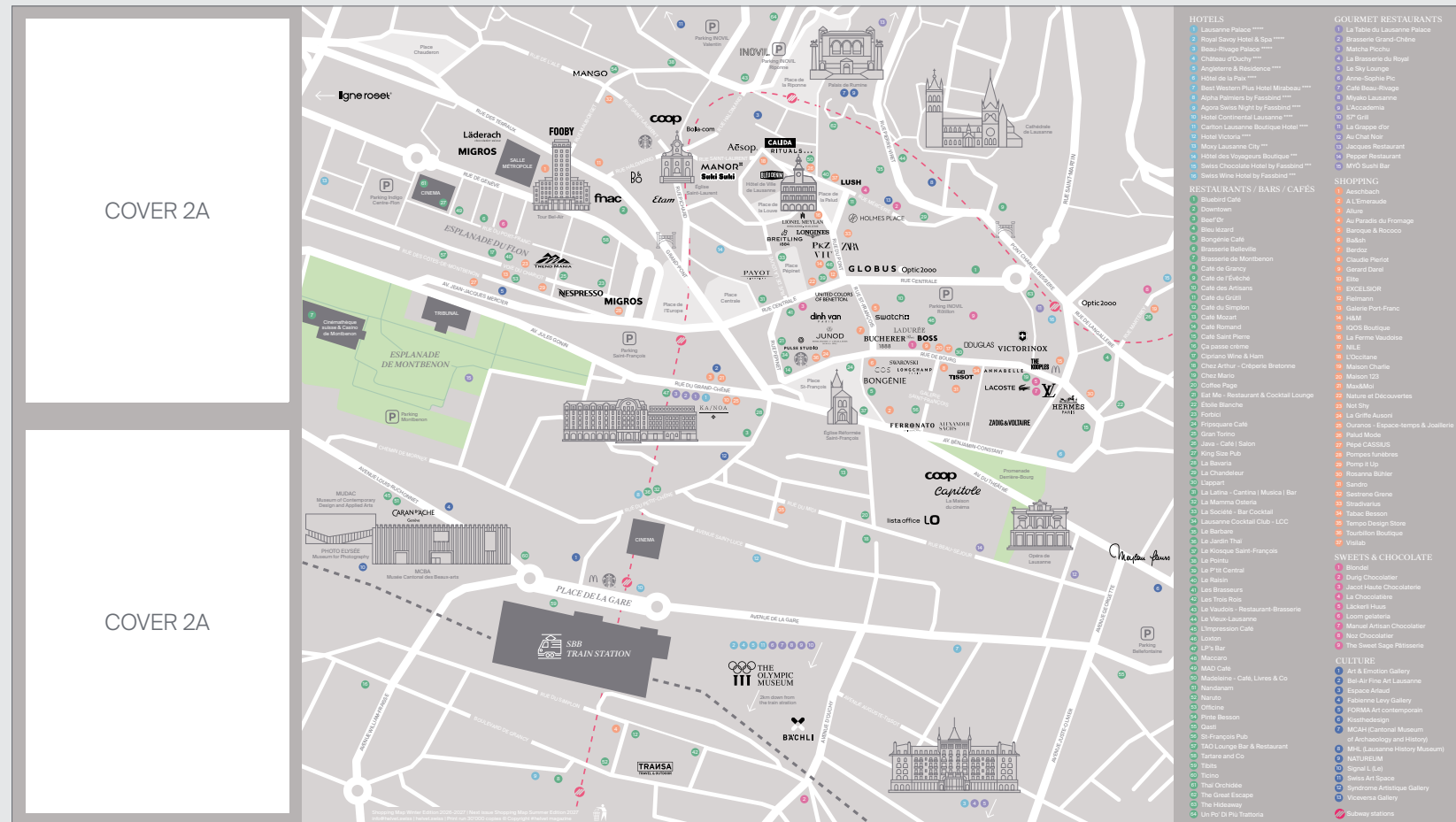
Nicht vertraglich festgelegtes Bildmaterial