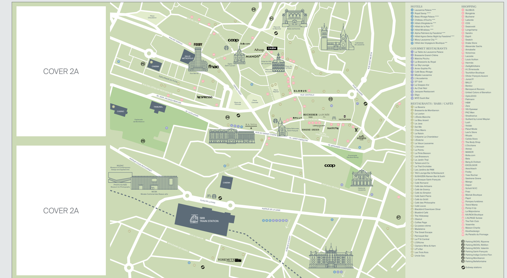
Nicht vertraglich festgelegtes Bildmaterial