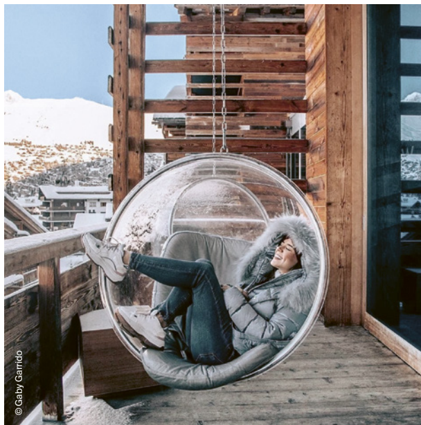
Au W Verbier, on se relaxe dans sa bulle, face aux panoramas montagnards, avant de rejoindre la terrasse après-ski du Off-Piste.