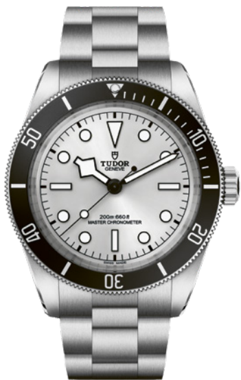
Tudor Black Bay 68

1968. Cette année-là, la signature esthétique de Tudor prend vie avec les emblématiques aiguilles dites « Snowflake ». On les retrouve sur cette nouvelle pièce, digne représentante de la collection Black Bay regroupant tous les codes de la marque dans un boîtier acier satiné poli de 43 mm, avec lunette unidirectionnelle graduée en aluminium noir. Son calibre manufacture offrant une réserve de 70 heures est certifié « Master Chronometer » METAS.