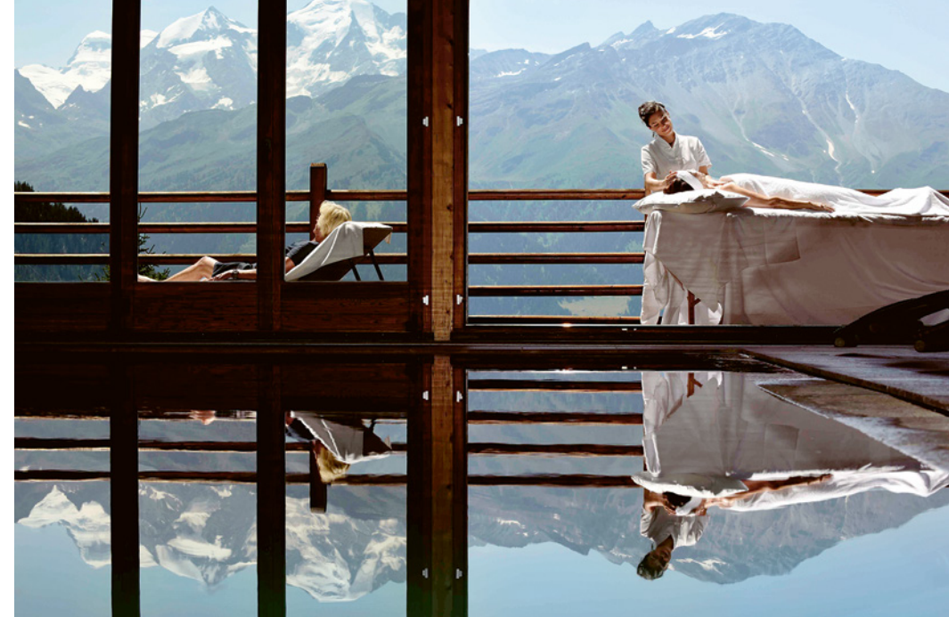
Bois, pierre, lumière et panoramas, les ingrédients phares du spa du Chalet d'Adrien, à Verbier, sont déjà en soi une promesse de relaxation.

mots? Nature et reset mental. De la randonnée guidée à la recherche de plantes médicinales ou anti-stress, au dessin en montagne, en passant par la danse extatique ou ce bon vieux yoga... Si les chakras ne sont pas alignés après tout cela, les chaleureux échanges autour d'un dîner, au creux de panoramas à couper le souffle, auront sûrement raison de leur obstination. Car c'est aussi cela que viennent chercher les participants.