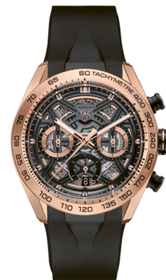
Tag Heuer Carrera Chronograph Extreme Sport

Fidèle à l'esthétique de la Carrera, née il y a désormais plus de six décennies, cette pièce horlogère allie l'audace sportive à un certain chic, grâce à son boîtier en or rose 18K 5N de 44 mm. Le cadran ajouré, aux finitions NAC raffinées et centre noir grainé, offre de saisissants contrastes avec toutes les touches en or rose – des compteurs, aiguilles et index notamment. Ce bijou horloger bénéficie de 80 h de réserve de marche.