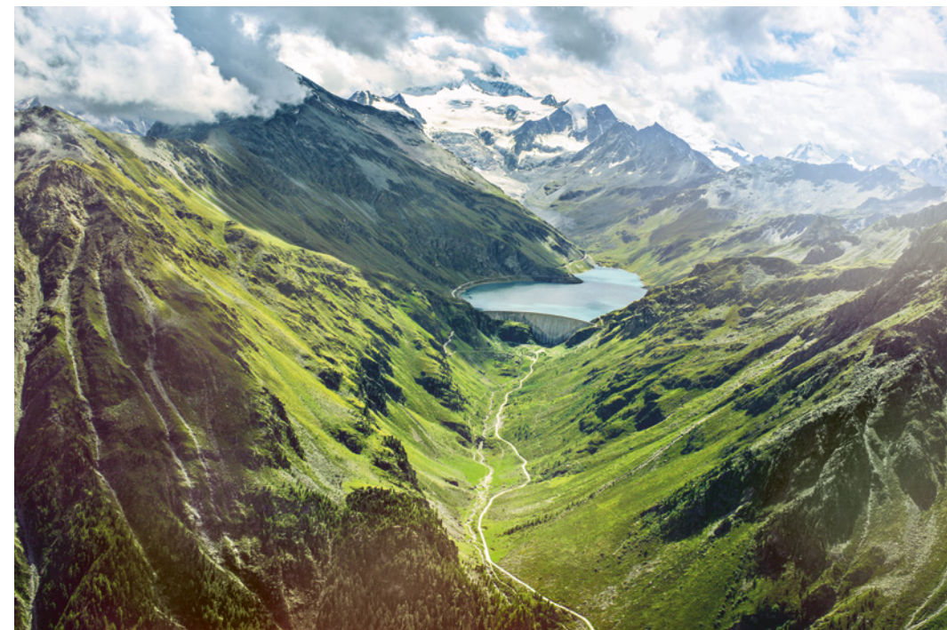
Niché dans un recoin du proche val d'Anniviers, le barrage voûte de Moiry a été mis en service en 1958. Volume de son lac: 78 millions de mètres cubes!

ROUTE DE VERBIER STATION 53 | VERBIER ELITEBEDS.CH