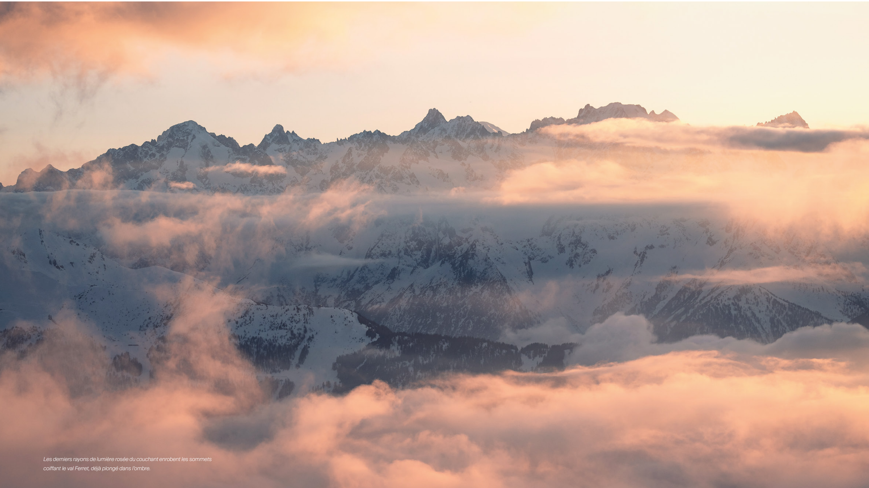
Les derniers rayons de lumière rosée du couchant enrobent les sommets coiffant le val Ferret, déjà plongé dans l'ombre.