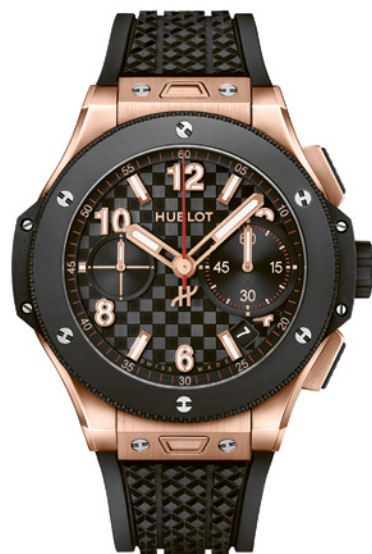
Hublot Big Bang King Gold Ceramic 20 th Anniversary

Cette pièce marie l'éclat de l'or 18K 5N à la robustesse de la céramique noire, élément phare chez Hublot. Boîtier poli-satiné de 44 mm, lunette céramique aux six vis « H », doubles compteurs et date à 4 h 30, les codes de la marque se dévoilent dans un look aussi racé que chic. Le mouvement chronographe automatique offre une réserve de marche de 42 h. Pour peaufiner le tout : un bracelet en caoutchouc structuré noir.