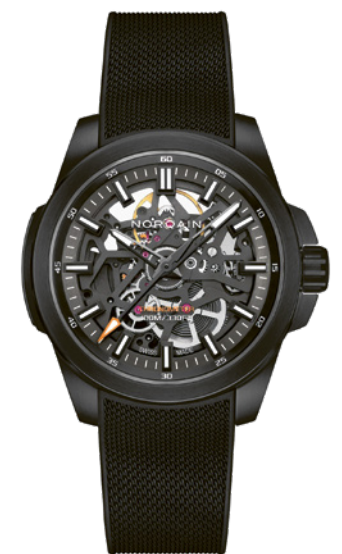
Norqain Independence Skeleton 40mm

Boîtier de 40 mm en acier inoxydable avec revêtement DLC, cadran squeletté, aiguilles des heures et des minutes facettées habillées de Super-LumiNova®, finitions brossées, polies et sablées, l'Independence Skeleton affirme un caractère bien trempé – complété par son bracelet en caoutchouc vert ou anthracite au motif « milanais ». En son cœur bat le calibre automatique manufacture NB08S, certifié COSC.