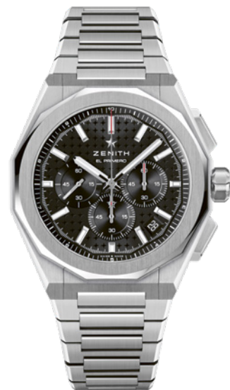
Zenith Defy Skyline Chrono

Il y a d'abord l'esthétique de son boîtier octogonal en acier de 42 mm, à lunette multi-facettes, et l'emblématique cadran ciel étoilé. En son sein, le calibre manufacture El Primero 3600 embarque une fonction chronographe précise au 1/10 e de seconde – dont l'aiguille centrale fait un tour en... 10 secondes. Il offre une réserve de marche de 60 h. Au choix : un bracelet en acier ou en caoutchouc à motifs noirs, facilement interchangeables.