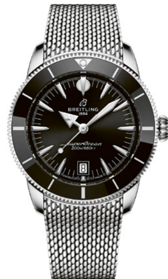
Breitling Superocean Heritage B31 Automatic 42

Cette plongeuse à l'éclat hypnotisant combine habilement héritage et performances contemporaines. D'un côté, les éléments-clefs de la collection : cadran épuré, date à 6 h et aiguilles « lance et flèche ». De l'autre, un boîtier en acier de 42 mm et une lunette unidirectionnelle avec insert en céramique, vibrant grâce au calibre manufacture B31, automatique (avec réserve de marche de 78 h). Le bracelet est en métal.