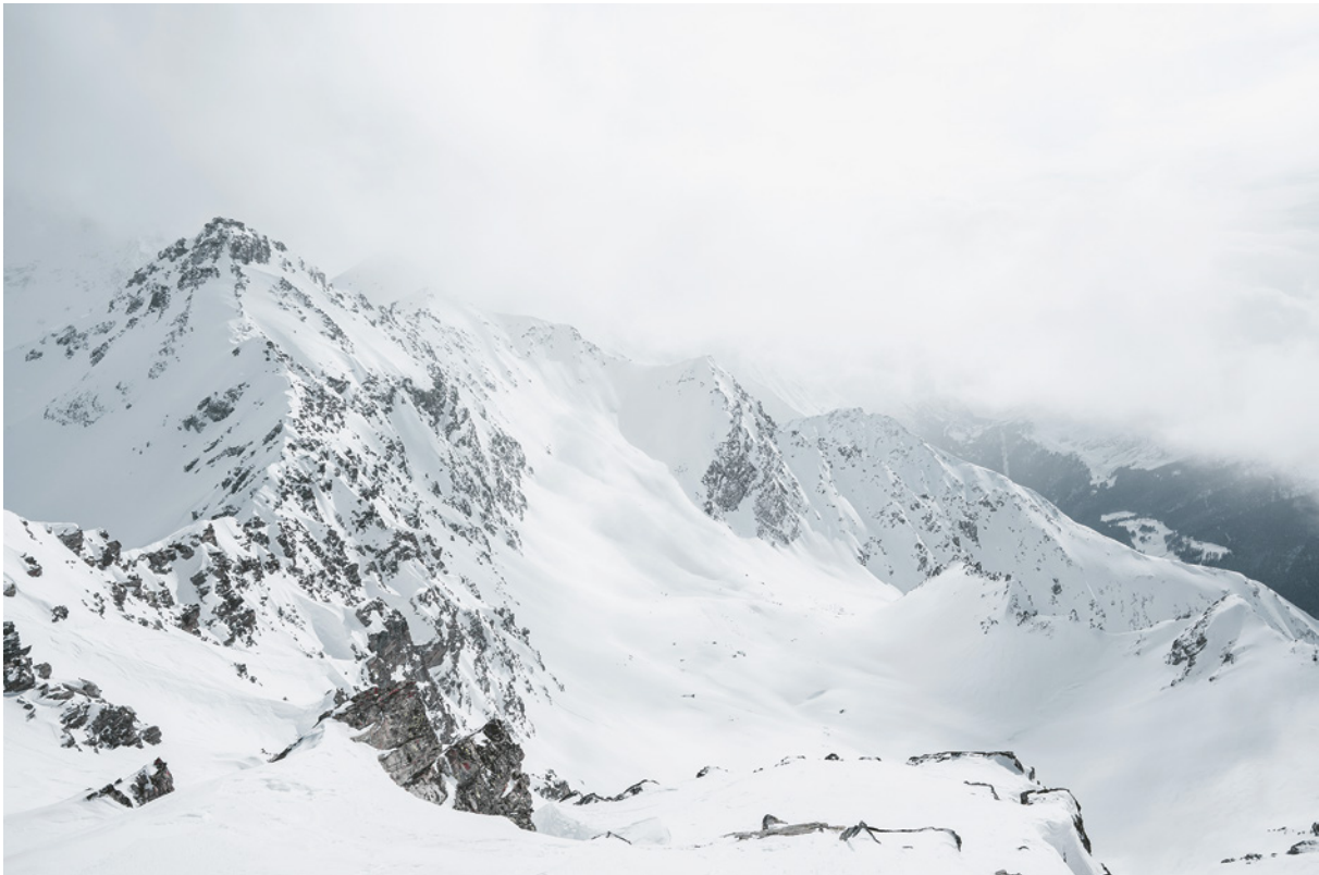
Sur le point d'être englouti par les nuées, le Grand Laget (3'132 m) fait l'objet d'une course magnifique, loin des foules.