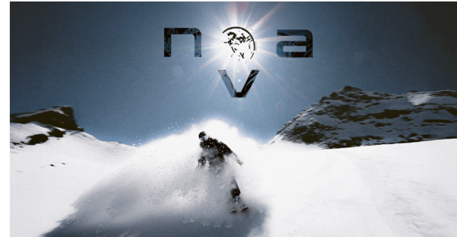
De la poudre, beaucoup de poudre, et un souffle onirique qui balaie les sommets : Nova, le premier film des frères Perraudin.

skis aux pieds. 87 e place. L'envie du rookie chevillée au corps, « mais je ne faisais clairement pas le poids », se souvient le jeune homme !